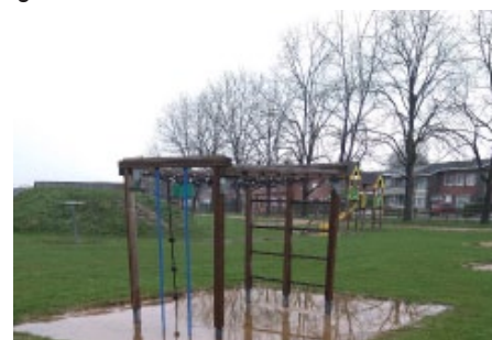
Speel- en recreatiemogelijkheden moeten goed onderhouden en opgewaarderd worden.