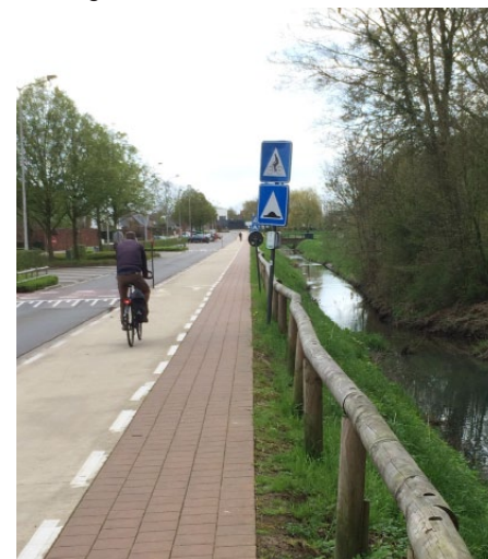
De inspanningen uit het verleden voor meer verkeersveiligheid moeten verder gezet worden.